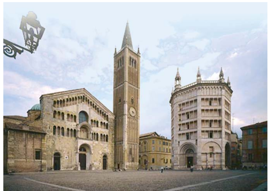
Veduta della Piazza del Duomo di Parma. In alto a sinistra l'Auditorium Paganini.

ECM, che precederanno l'inizio della Conferenza. Last but not least, la Città di Parma e la Regione Emilia-Romagna offriranno agli ospiti quanto hanno di meglio nel campo dell'arte, della cultura, dello spettacolo e della gastronomia, per unire all'interesse scientifico il piacere del soggiorno nel loro territorio: un motivo in più per non mancare. Nel programma preliminare allegato a questo bollettino sono pubblicati tutti i dettagli della manifestazione.