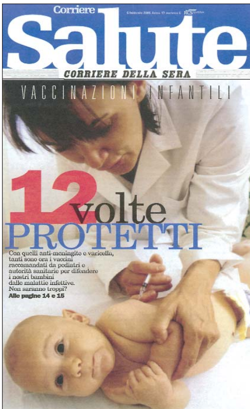
La prima pagina del "Corriere Salute".