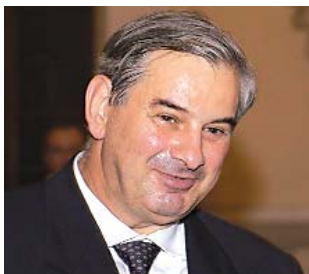
Il responsabile della Prevenzione del Ministero della Salute Donato Greco.

Del nuovo calendario vaccinale si è parlato in numerosi convegni e sui più diffusi organi di stampa (nella foto la prima pagina del Corriere Salute dell'8 febbraio).